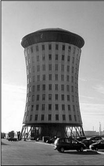
Gebouw De Bolder, gebouwd in 2001.

Natuurlijk waren er ook tegenslagen. Mijn broer Teun was al meerdere keren door een hartinfarct getroffen en besloot toen daarom in 1975 te stoppen. Wij zijn altijd een goed team geweest”.