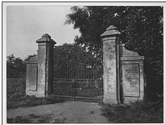
De oudst bekende foto