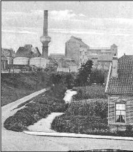
Afbeelding van rond 1920