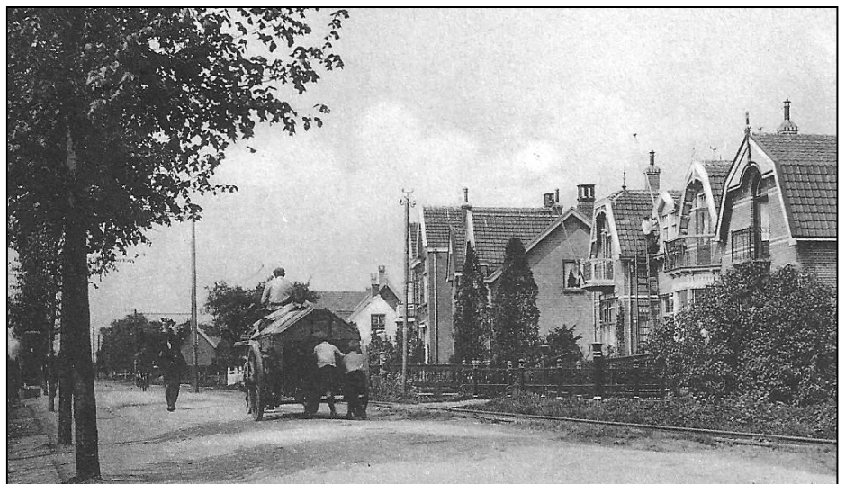
De strontkar of vuilniswagen, hier aan de Rotterdamseweg, omstreeks 1930

Kortom geef deze kar een "gezicht". Uw reacties op het bovenstaande zijn meer dan welkom. Dat kan per mail naar pieter@carladeklerk.nl . U kunt ook telefonisch reageren: 078-6122452.