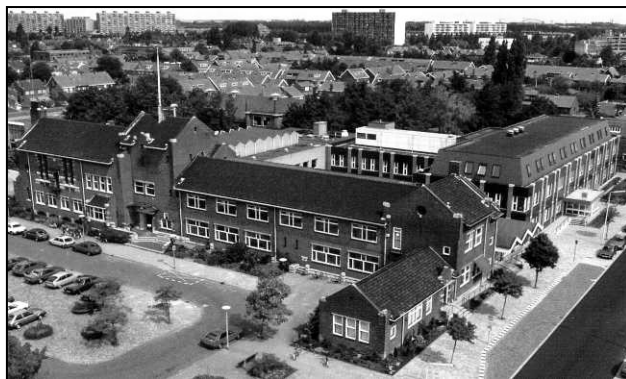
Een luchtfoto van de situatie in 1985

De aanpassingen, die in de loop van de tijd hebben plaatsgevonden, zijn zoveel mogelijk ongedaan gemaakt. De kleuren van de glas-in-loodramen, kobaltblauw, mosterdgeel en roodbruin, zijn terug te vinden in de ruimte.