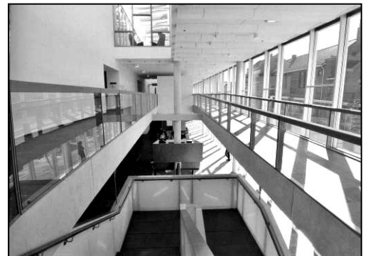
Links het interieur zoals dat er in 1933 uitzag en rechts het interieur van de nieuwe vleugel. Alles zeer harmonieus op elkaar afgestemd.

De aanpassingen, die in de loop van de tijd hebben plaatsgevonden, zijn zoveel mogelijk ongedaan gemaakt. De kleuren van de glas-in-loodramen, kobaltblauw, mosterdgeel en roodbruin, zijn terug te vinden in de ruimte.