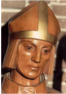
Houten beeld van bisschop Ansfridus met een helm aan zijn voeten, in de Sint-Ansfriduskerk te Amersfoort.

Keizer Koenraad II bevestigde de gift op 3 februari 1028 en op 26 juni 1050 deed bisschop Bernoldus hetzelfde, met een vermeerdering van nog enkele giften.